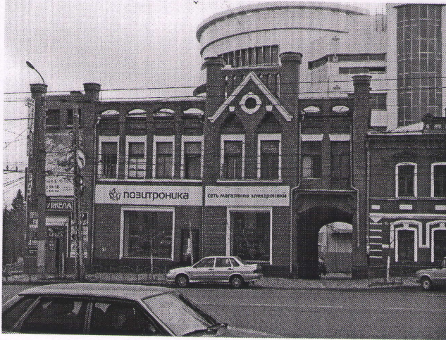
Внешний вид объекта